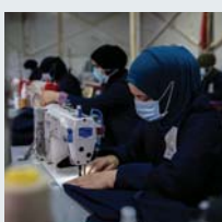
۶۶ | زيکراوي نيوههولهتي کوچ