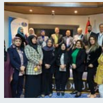
۷۲ | زيکراوي نافرماتاني نتموه بهکرتوههکان