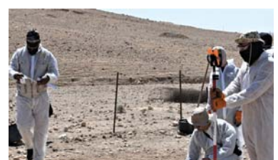
۱۶ | يونيتاد و هاوبهشي پيشهنگي دهسهلاتي دادوهري عيراق بهره لپرسينهوه له تاواه نيوههولهتيهکان داتش له عيراق