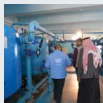
۶۸ | نووسينگه نتموه بهکرتوههکان بؤ همامهنگي کاروباري مرويي