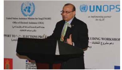
۱۸ | چاوپیکهوتن د. نعيم نارايين راويژکاري سرهکس همليژاردن و بهريزه بهري هاريکاري همليژاردن پيکرتوهي نتموه پيکرتوههکان