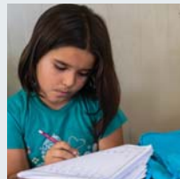
۴۹ | زيکراوي يونيسيف