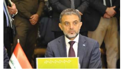
۱۶ | چاوپیکهوتن بهريز محمد نهلنجار بهريسي نويسينگه کاروباري سياسي و شيکاري يونامي به وهکالت