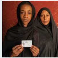
۳۸ | کؤمسياري بالاي نتموه بهکرتوههکان بؤ پهناپهران