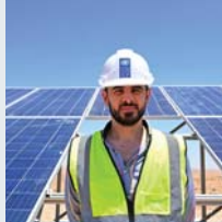
۳۲ | بهرينامي نتموه بهکرتوههکان بؤ گشمهچيدان