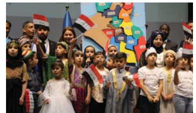
۱۹ | پرسپار و وهلم لهگهل نووسينگه مافهکان مروف