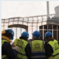
۴۶ | زيکراوي نتموه بهکرتوههکان بؤ پهرمهده و زانست و روشنييري - يونيسکو