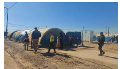
۱۹ | وردهکاري بهک له چالاکيهکان نووسينگه همامهنگي نيشتهچيکرتنهکان RCO- نووسينگه پشتگيري کشمهچيدان DSO له سال ۲۰۲۲