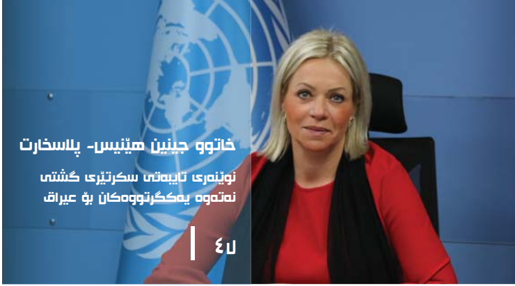
خاتوو جینین ھینیس- پلاسارت نۆینەری تایبەتی سكرتیری گشتی نەتەوە یەكگرتووەكان بۆ عێراق