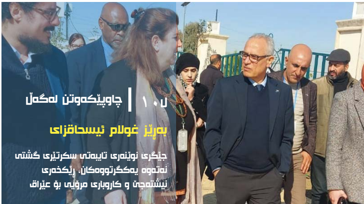
جێگرای نۆینەری تایبەتی سكرتیری گشتی نەتەوە یەكگرتووەكان لە عێراق، بۆ كاروباری سیاسی و ھاریكاری ھەلبژاردنەكان