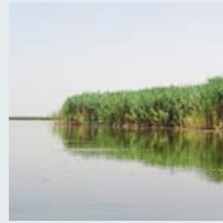
۳۴ | بهرينامي نتموه بهکرتوههکان بؤ زينگه