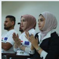
۴۰ | ناوهکي بازارگاني نيوههولهتي