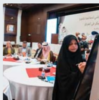
۵۴ | سندوقي نتموه بهکرتوههکان بؤ دانيشتوان