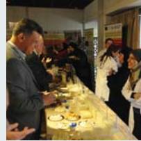
۳۰ | زيکراوي خوراک و کشتوکال