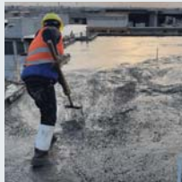
۳۶ | بهرينامي نتموه بهکرتوههکان بؤ نيشتهچيکرتنه مرويي - هاييتات