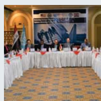
۶۲ | نووسينگه نتموه بهکرتوههکان بؤ ماده مؤشهرهکان و تاوانهکان