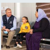
۵۸ | زيکراوي تمندروستي جيهاني