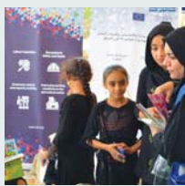
۷۰ | زيکراوي نيوههولهتي کار