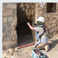
۵۰ | زيکراوي نتموه بهکرتوههکان بؤ کاروباري مين