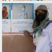
۵۶ | نووسينگه نتموه بهکرتوههکان بؤ خزمهتگوزاري پروزهکان