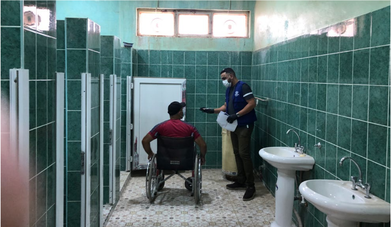
شكل 10: تقييم تشاركي للمركز المجتمعي التابع للمنظمة الدولية للهجرة في كركوك