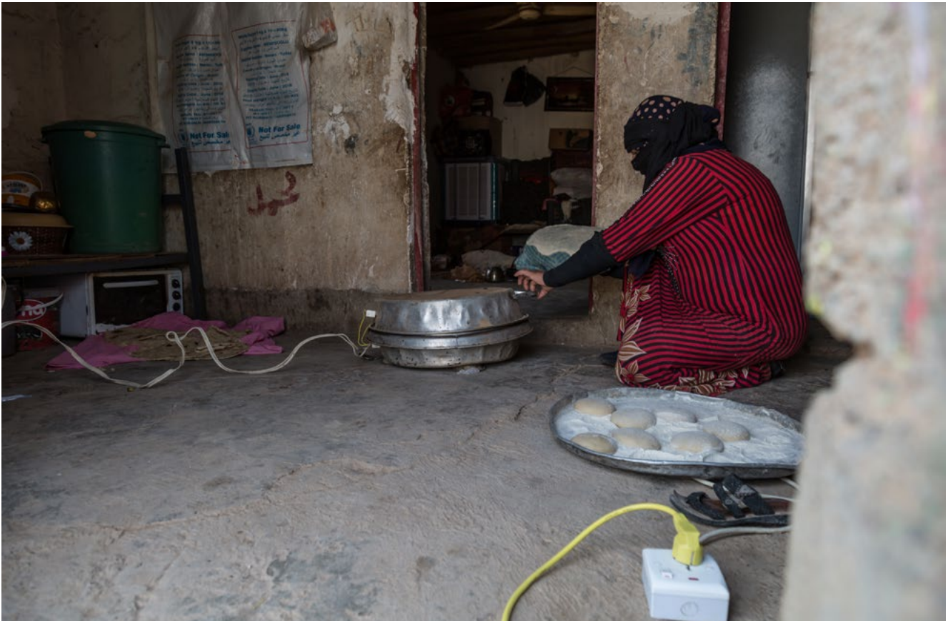
شكل 5: إحدى النساء من اربيل وهي تطبخ الطعام لعائلتها

على مدار سنواتٍ عديدة، تقدمت المنظمات المعنية بالأشخاص ذوي الإعاقة بالتماساتٍ إلى الحكومة ولكن دون جدوى لتناول مشكلاتٍ تتضمن مسألة إمكانية الوصول في البنية التحتية العامة والتعليم. ففي معظم الأوقات، لم يكن هناك أي استجابة أو إجراء وعليه تشعر تلك المنظمات بالتجاهل والاستبعاد. وأوضح المشاركون أنه نشأ عن هذا الأمر شعورهم بالإحباط وانعدام الثقة. ألقى المشاركون الضوء على العديد من الملاحظات التي ساعدت في تعظيم شعور الإحباط لديهم لتشمل