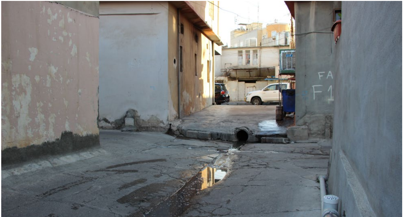
شكل 7: شارع في اربيل

أما مسألة الالتحاق إلى التعليم الإلكتروني عبر الإنترنت نتيجة للقيود المفروضة من جراء جائحة كوفيد-19 قد نشأ عنها وجود صعوبات لدى الطلاب من ذوي الإعاقة البصرية؛ نظراً لاعتمادهم حالياً على طريقة برايل وآلات القراءة التي لا يُمكن استخدامها في التعليم عبر الإنترنت. أوضح المشاركون أن الأطفال ذوي الإعاقة لديهم مشكلات نفسية اجتماعية بسبب استبعادهم من المدارس والتعليم. في حين نمت بعض التقارير الإيجابية لدى المدارس في إقليم حكومة كردستان التي تتضمن الأطفال ذوي الإعاقة. وبالتالي، أعطت المنظمات المعنية بالأشخاص ذوي الإعاقة الأولوية لرفع الوعي بشأن التعليم الشامل لدى الإدارات التعليمية والمدارس والمعلمين وأفراد المجتمع في البلديات