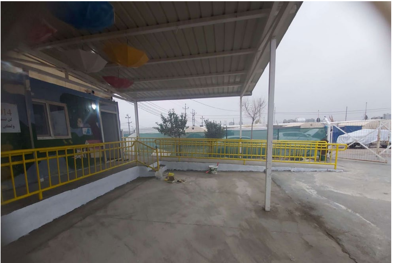
شكل 2: إمكانية الوصول في احد المراكز المجتمعية التابعة للمنظمة الدولية للهجرة في دهوك

وفي عام 2020، وضعت وحدة الاستقرار المجتمعي (CSU) التابعة للمنظمة الدولية للهجرة في العراق إطار العمل التالي: نهج وحدة استقرار المجتمع في تعميم دمج ذوي الإعاقة ضمن البرامج في عام 2020 لضمان دمج الأشخاص ذوي الإعاقات المختلفة في كافة مشروعات ومبادرات وحدة استقرار المجتمع. ومن ضمن الأنشطة التي تضمنها هذا الإطار هو عقد مشاورات قائمة على الجولات الميدانية والتشارك