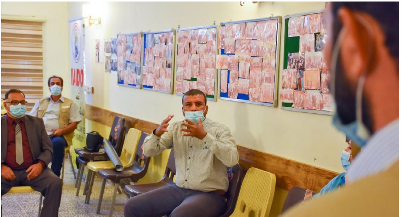
شكل 8: رابطة الأشخاص الصم في العراق أثناء مشاركتها في تدريب في بغداد

مشارك من ذوي الإعاقات السمعية، رئيس إحدى المنظمات المعنية بالصم المكفوفين بمحافظة كركوك