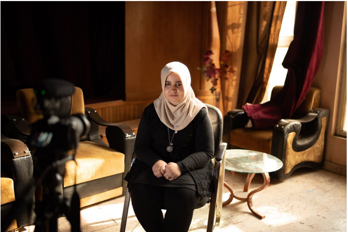
شكل 3: داستان اثناء تصوير فيديو حول المدافعة عن حقوق الاشخاص ذوي الإعاقة