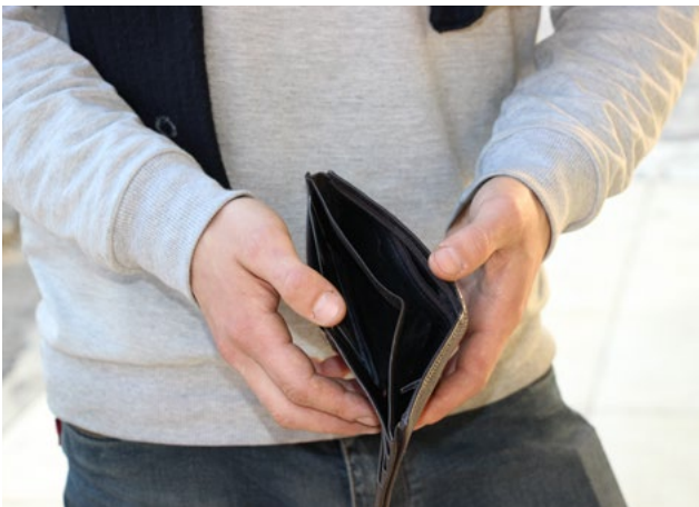
شكل 6:

مشاركة من ذوات الإعاقة البصرية، محافظة البصرة.