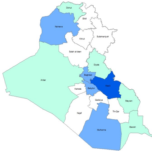
People with Insufficient Food Consumption

0 - < 5% Very low 5 - < 10% Low 10 - < 20% Moderately low 20 - < 30% Moderately high 30 - < 40% High > 40% Very High