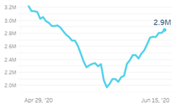
الشكل 1: عدد الأشخاص الذين لديهم استهلاك غذائي غير كاف. حيث يشير الاستهلاك غير الكافي إلى أولئك الذين يعانون من استهلاك غذائي ضعيف وحدودي وفقاً لمعيار استهلاك الطعام

لم تشهد أسعار السلع الأساسية أي تغير كبير على المستوى الوطني بشكل عام وعلى مستوى المحافظات بالمقارنة مع الأسبوع الثاني من شهر حزيران.