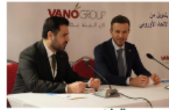
مجموعة فانو Vano group