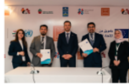
مجموعة هاكس HAKS

3 Partnerships signed with Major Companies in support of ITC-SAAVI Agribusiness Alliances