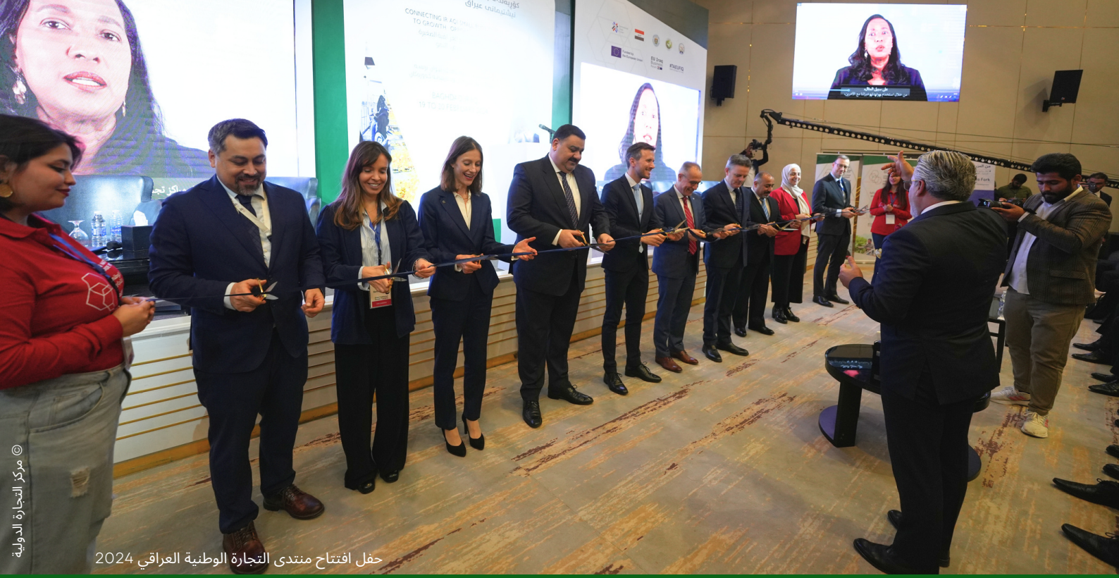
حفل افتتاح منتدى التجارة الوطنية العراقي 2024