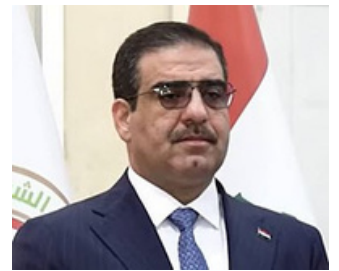
الاستاذ اثير داوود الغريبي معالي وزير التجارة العراقي

"يمثل المنتدى التجاري الوطني العراقي الثاني شهادة على طموحنا الجماعي لتعزيز الحوار والتماسك والتعاون بين القطاعين العام والخاص. إن العراق في رحلة لتحفيز الشراكات التجارية وتأمين الاستثمار المستدام، وتجاوز التحديات الاقتصادية لإطلاق الإمكانيات الكاملة لبيئة الأعمال في العراق. وبينما نعمل على توحيد الشركات العراقية متناهية الصغر والصغيرة والمتوسطة الحجم مع الموردين والمستثمرين الدوليين، فإننا نضع الأساس لاستراتيجية قوية بين القطاعين العام والخاص. إن وزارة التجارة ملتزمة بتسريع اندماج العراق في الاقتصاد العالمي من خلال الانضمام إلى منظمة التجارة العالمية، وضمان مستقبل يزدهر فيه العراق كلاعب رئيسي في النظام التجاري متعدد الأطراف، مع الالتزام بالمعايير الدولية من أجل بيئة أكثر ازدهاراً وملائمة للاستثمار."