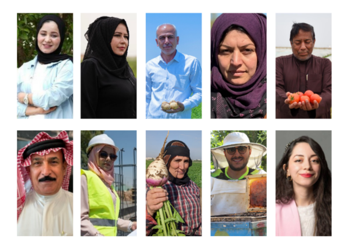
ITC in Iraq Transforming Trade, Changing Lives

In Iraq, ITC builds trade-led growth for inclusive prosperity. Currently, ITC is implementing two European Union-funded projects in Iraq: