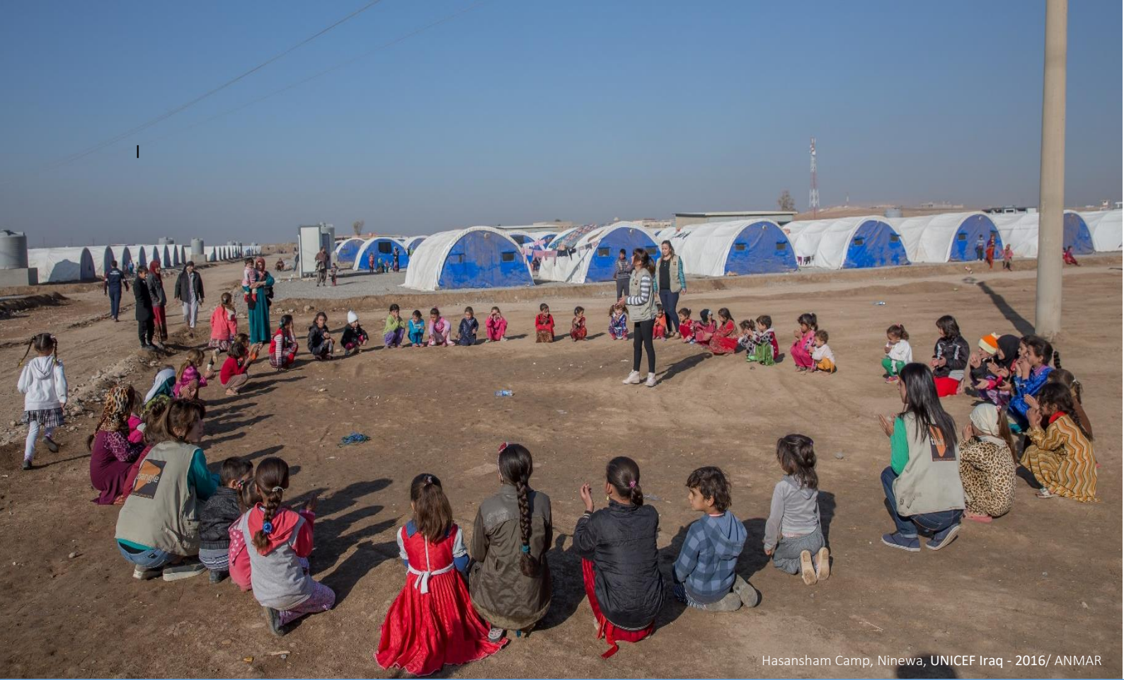
Hasansham Camp, Ninewa