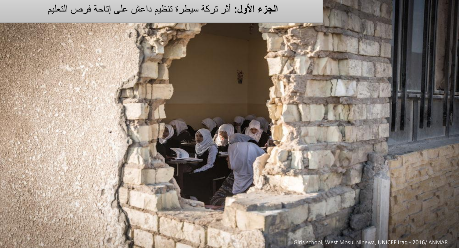
Girls school, West Mosul Ninewa, UNICEF Iraq - 2016/ ANMAR

الجزء الأول: أثر تركة سيطرة تنظيم داعش على إتاحة فرص التعليم