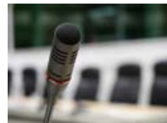
Launch of the TVET strategy