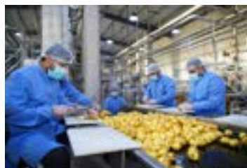
Launch of the Iraq's Potato Sector Strategy