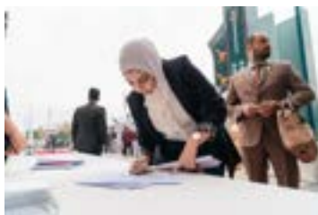
Second Iraq National Trade Forum